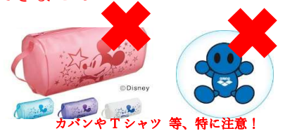
カバンやTシャツ 等、特に注意！