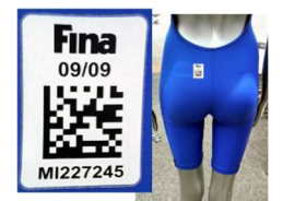
お尻のところに FINA マークのある水着のみ出場可

※上記画像や説明は、あくまでジュニア委員会の試合などの、公認・公式大会出場に関する注意事項の理解を促すために使用しており 特定の商品に対して販売促進や妨害の意図を持つものではありません。 ご理解ください。